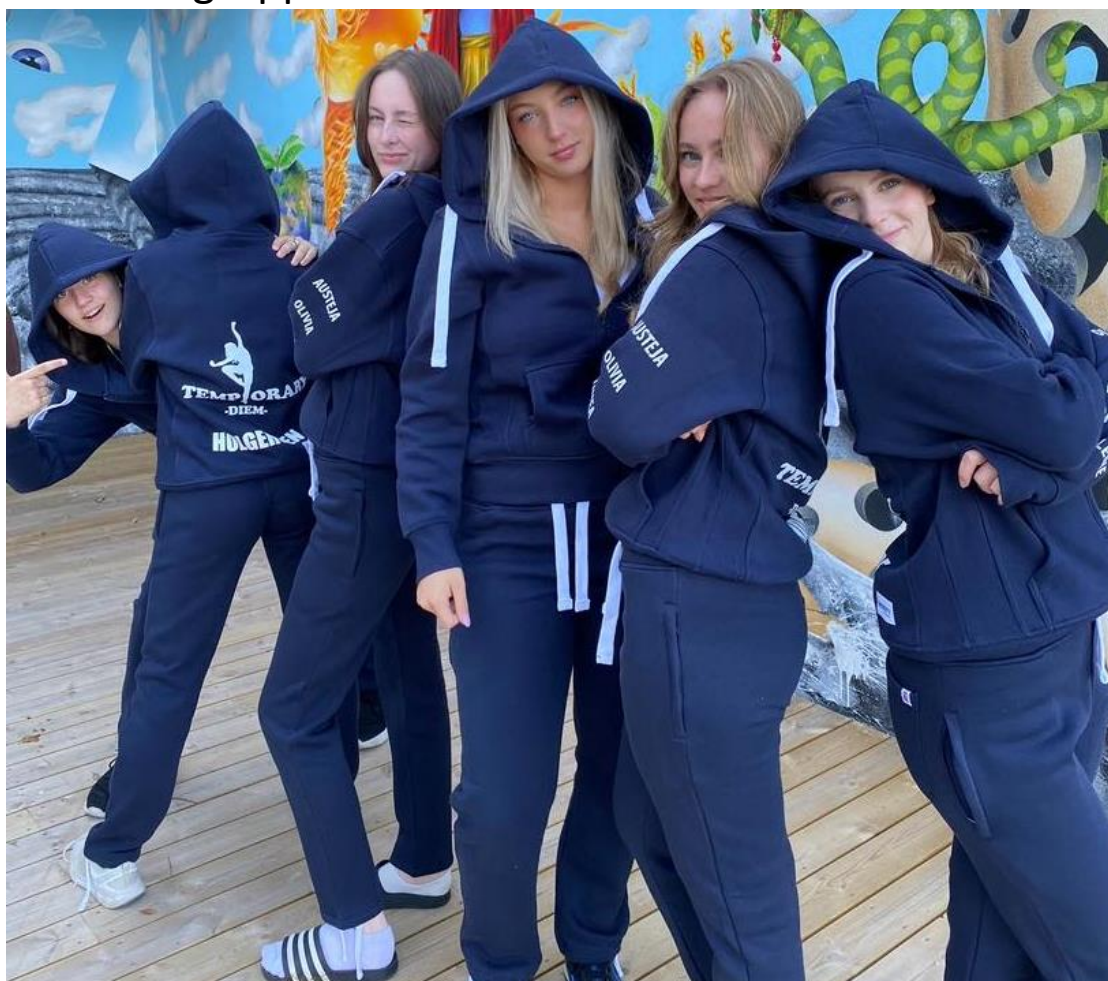
Den flotte instruktørgjengen i DUG-Balestrand.

Det er heilt vanleg å vere usikker. Mitt råd er «å berre hoppe i det». DUG Balestrand har gått frå å vere nokså små til at vi dette året har fire ulike dansegrupper. Det er kult!